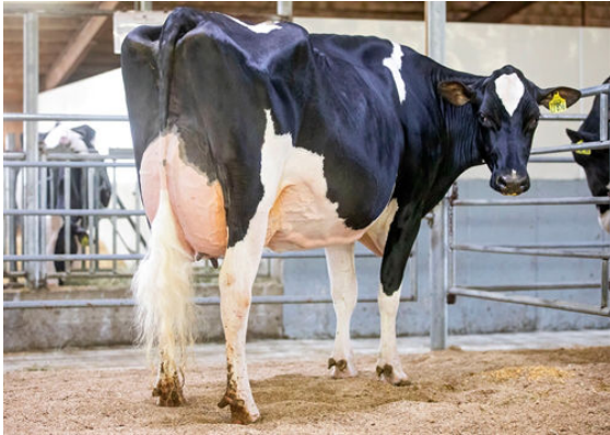
SIEMERS LMDA PARIS 27856 DAM