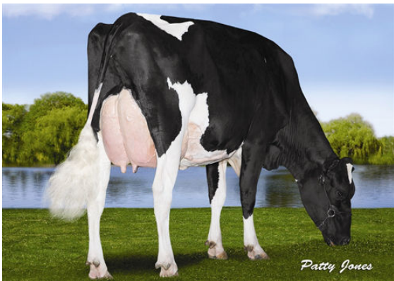
RANSOM-RAIL FACEBK PARIS FOURTH DAM